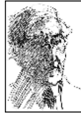
Ο Κωνσταντίνος Καβάφης, σε αχρονολόγητο σχέδιο από τον Γιάννη Κεφαλληνό.