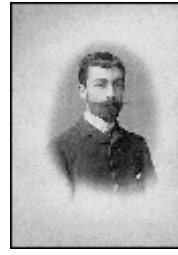
Ο Παύλος Καβάφης (1860-1920), σε φωτογραφία βγαλμένη στην Πόλη, πιθανώς το 1885.