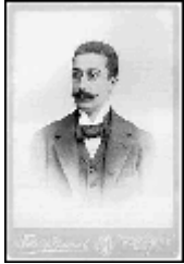
Ο Κωνσταντίνος Καβάφης, σε φωτογραφία βγαλμένη στην Αλεξάνδρεια, πιθανώς το 1890.