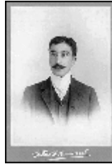
Ο Κωνσταντίνος Καβάφης, σε φωτογραφία βγαλμένη στην Αλεξάνδρεια, χρονολογημένη διστακτικά από τον ίδιο "1901 ή 1903".