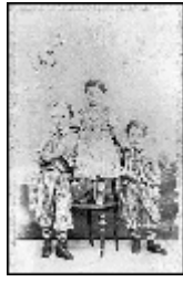
Ο μικρός Κωνσταντίνος Καβάφης, σε ηλικία 2 ετών, ανάμεσα στους αδελφούς του Τζων (αριστερά) και Παύλο (δεξιά). Η χρονολογία στη φωτογραφία γραμμένη με το χέρι του ποιητή.