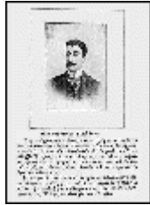
Φωτογραφία και βιογραφικό σημείωμα του Καβάφη από το "Ημερολόγιον 1899" του Δρακόπουλου.